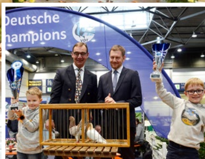
Eröffnung LIPSIA-Schau 2023 mit Ministerpräsident Michael Kretschmer.