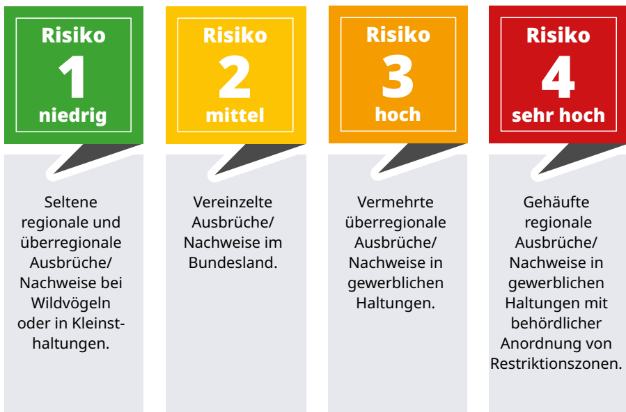
Tab. 1: Risikobewertung für den Ausstellungsbetrieb nach Regionalität und Haltungsart