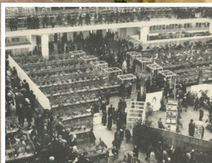
Blick in eine der Ausstellungshallen der LIPSIA-Schau in Leipzig in den 1960er Jahren.